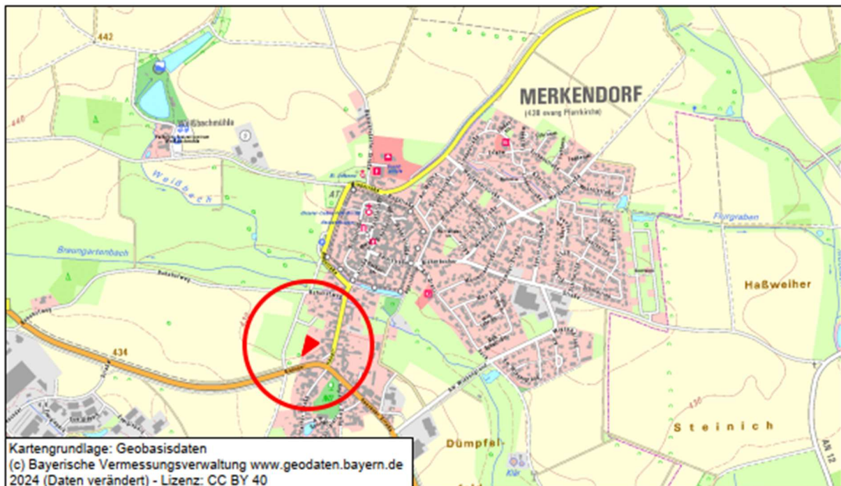
Übersichtslageplan zur Lage der Änderung des Flächennutzungsplans mit integriertem Landschaftsplan im Stadtgebiet, ohne Maßstab

Der Änderungsbereich umfasst das Grundstück mit der Flurstücknummer 269/2 der Gemarkung Merkendorf zum Zeitpunkt der 13. Änderung des Flächennutzungsplans.