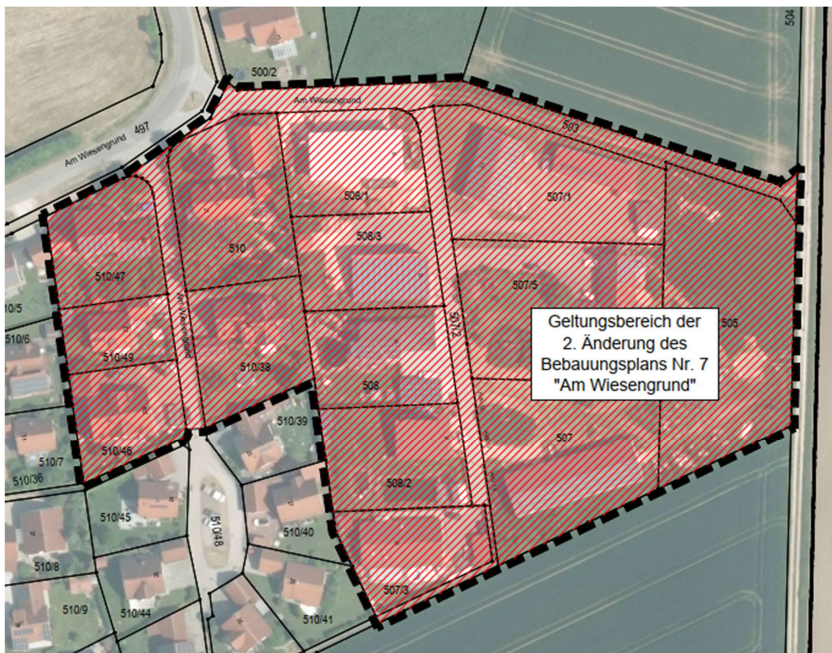
Geltungsbereich der 2. Änderung des Bebauungsplans Nr. 7 „Am Wiesengrund“

Die weiteren Verfahrensschritte erfolgen zu einem späteren Zeitpunkt und werden gesondert bekannt gemacht.